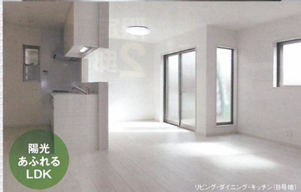
陽光 あふれる LDK