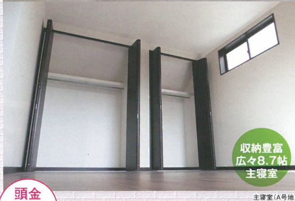
収納豊富 広々8.7帖 主寝室